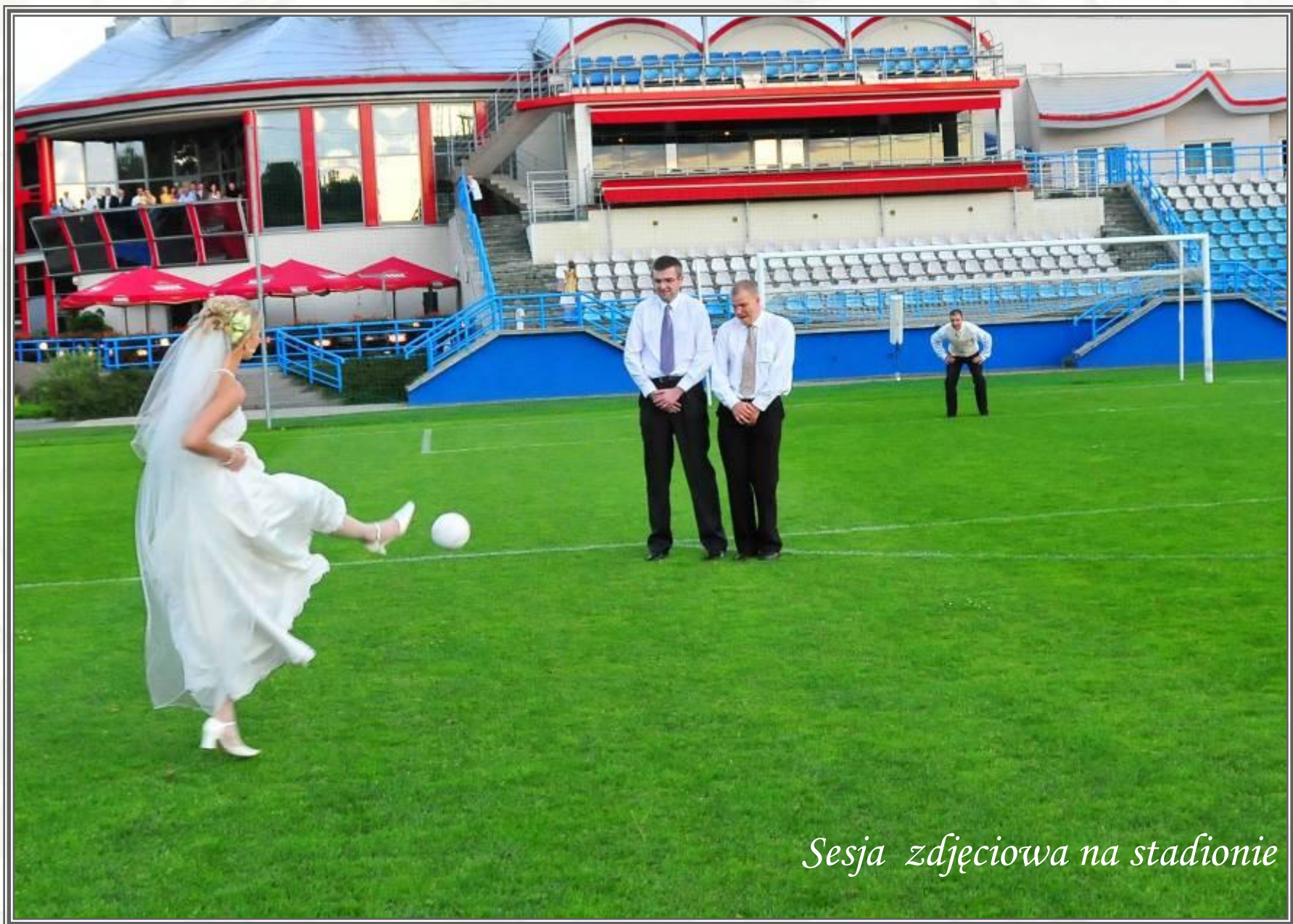
Sesja zdjęciowa na stadionie