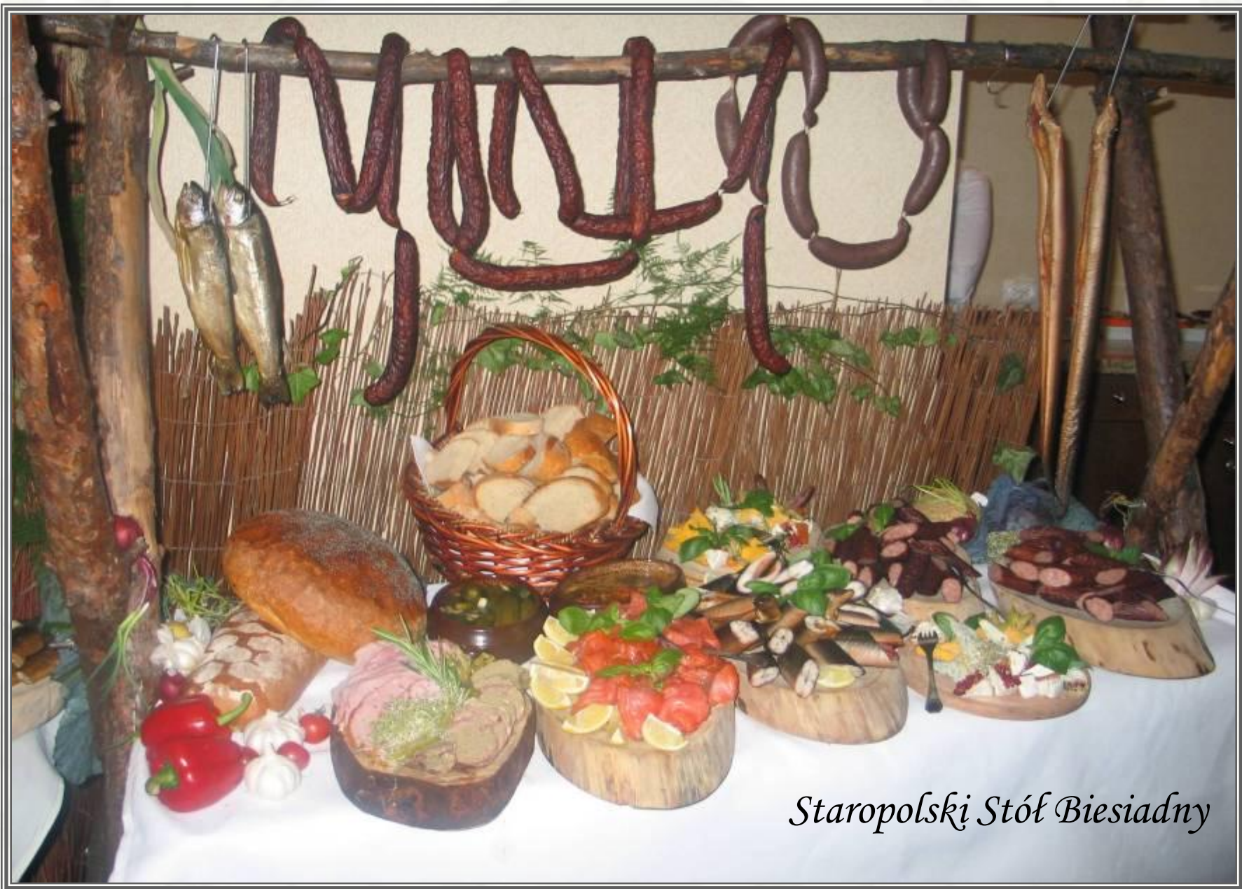
Staropolski Stół Biesiadny