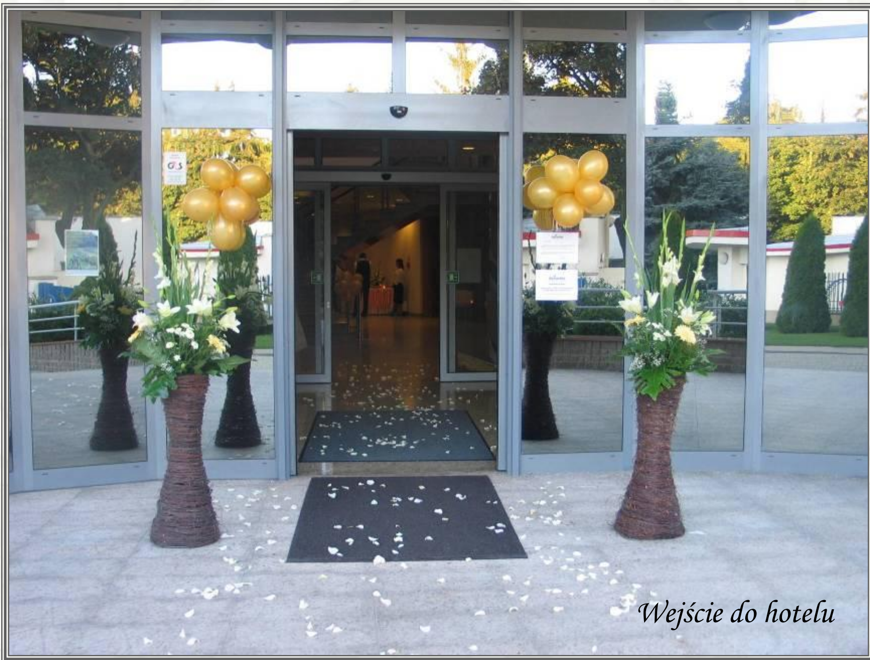
Wejście do hotelu